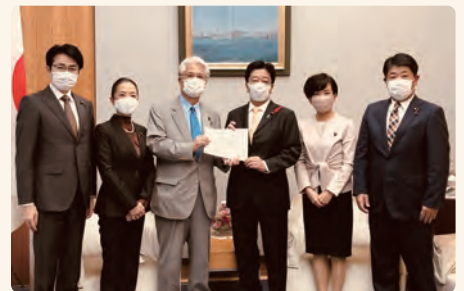
▲ 少人数学級の推進を求める決議を官房長官に提出

全国の子どもたちにひとり 1 台端末を購入が実現。しかし買換え・更新時の予算 に不安あり。予算配分を行うように要求。