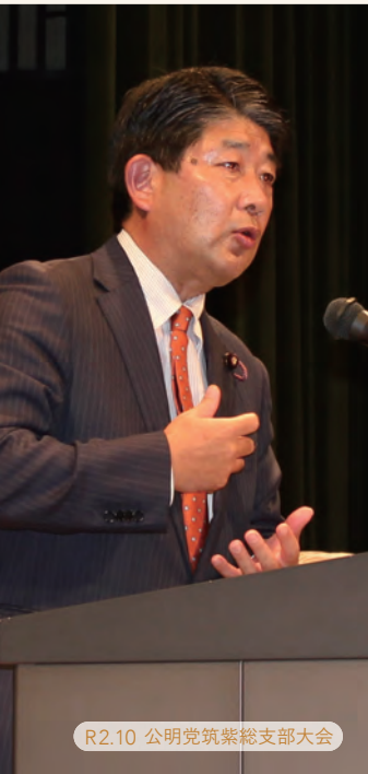
R2.10 公明党筑紫総支部大会